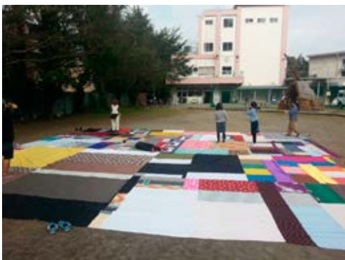
寄せられた布を縫い合わせた 大風呂敷 Cloth used for furoshiki

F/T14のオープニングとして、『フェスティバルFUKUSHIMA! @池袋西口公園』が2日間行われた。プロジェクトのシンボルと言える大風呂敷が地面いっぱいに敷かれ、色とりどりの布が檜やステージを彩り、音楽家の大友良英が指揮を務めた池袋西口オーケストラの即興演奏や多彩なアーティストによるライブ、盆踊りで大いに盛り上がった。フェスティバルFUKUSHIMA!は、2011年の東日本大震災以降、大友や音楽家の遠藤ミチロウ、詩人の和合亮一などのメンバーで結成されたプロジェクトFUKUSHIMA!が、福島を「今」を世界へ発信することを目的に多くの人を巻き込みながら、各地で開催してきた祭りだ。今回初開催となった東京でも、大風呂敷のために全国から布が寄せられ、ボランティアスタッフが2週間かけて縫い合わせた。また、池袋西口オーケストラの3日間のワークショップには200人近い参加があった。さらに、今回のために大友が手がけた新曲「池袋西口音頭」の歌詞の創作にあたっては、池袋にまつわる言葉を一般から広く募集。珍しいキノコ舞踊団の伊藤千枝によるユニークな振付は大きな盆踊りの輪を生んだ。多くの人々が様々な形で参加し、老若男女を問わず誰もが参加できる祭りを作り上げた。