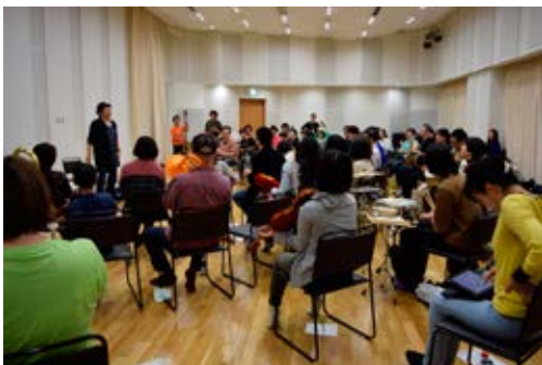
池袋西口オーケストラ ワークショップ Ikebukuro Nishiguchi Orchestra workshop