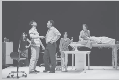
サンプル『ファーム』（2014年）

西尾 昨日稽古場で話したのは、少し前から公園のベンチに仕切りが付くようになりましたよね。私はベンチは座るものとしかと思っていなかったので「特に要らないけど、あってもいいか」程度に認識していたんですね。でもそれはホームレスを寝られなくするのが本当の目的で、ホームレスの人からすると自分を攻撃するもの、排除するものに見え