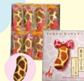
人氣聚集的東京香蕉布丁味的特別版， 具有香蕉布丁味的奶油鬆軟蛋糕。