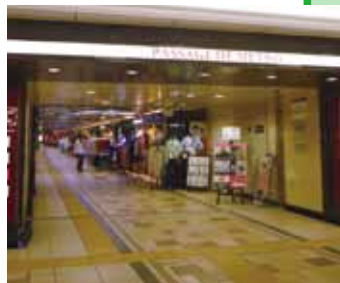
以“池袋蒙帕納斯”為目標，靈活應用了充滿藝術和文化氣息的池袋街道的車站地下設施。