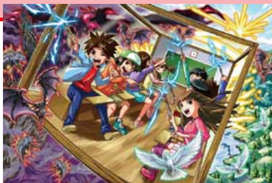
新遊玩節目「神奇的體驗！魔法學園」(參考圖)