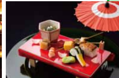
請品嚐使用了四季時鮮食材的傳統日本佳肴日本料理「花MUSHASHI」