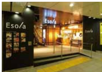
由於鄰接著池袋站，即使是雨天不用打傘既能購物。