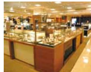
6樓的8-10番地的“鐘錶沙龍”