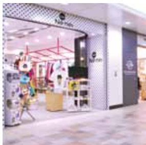
為每天繁忙的女性而設的具有Echika特色的時裝雜貨區。