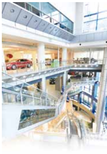
從地下1樓到4樓， 陣容龐大的豐田汽車。