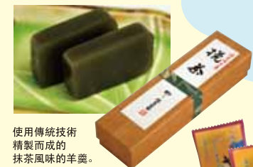
使用傳統技術 精製而成的 抹茶風味的羊羹。