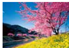
伊豆 (静岡) 伊豆 (静岡)

詳情請查詢 東京單軌電車 檢索 http://www.tokyo-monorail.co.jp/tc/index.html