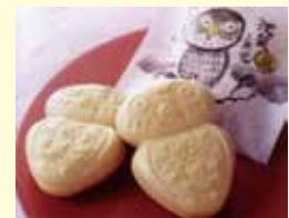
以北海道十勝產的豆沙和白玉粉為 餡，外形是一個像池袋的可愛的 貓頭鷹。