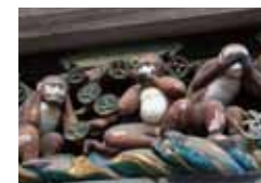
日光 (栃木) 日光 (栃木)