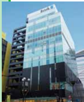
若隱若現的以黑色為基調的I型設計。