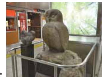
池袋站內的“貓頭鷹像”

另外，日語“幸福”（FUKU）的發音和貓頭鷹（FUKUROU）的發音接近，所以“貓頭鷹像”也是幸福的象徵。