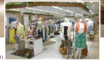
3樓 女性服飾 (R.U)