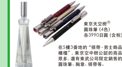
東京天空樹® 圓珠筆 (4色) 各3990日圓 (含稅)

在5樓3番地的“領帶·男士飾品櫃檯”，東京天空樹公認的商品眾多，還有東武公司限定銷售的圓珠筆、胸章、領帶等。