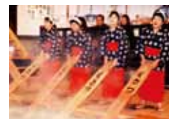
草津溫泉 (群馬) 草津溫泉 (群馬)