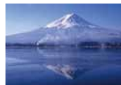
河口湖 (山梨) 河口湖 (山梨)