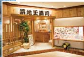
8樓「築地玉壽司」餐廳