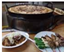
請品嚐肉燒豆腐和烤豬肉。