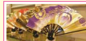
有舞扇和裝飾扇等扇子，融入了日本文化的各種 各樣的紙製品。