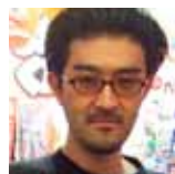
構成・演出：高山明

本作のタイトルは鶴見済の「完全自殺マニュアル」(93年)からインスパイアされたもの。せわしない「東京の時間」から、わたしたちはいかに「避難」できるのか。わたしの「避難所」はどこ？探すならまずはアクセスを。